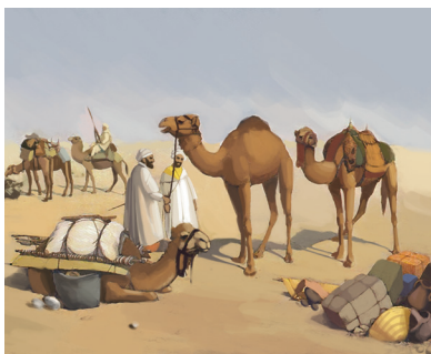
Көшпелі араб тайпалары - бедуиндер

сендер 610-1258 жылдар аралығында ислам әлемін өзгерткен оқиғаларды анықтайсыңдар.